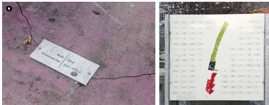
9. Placa indicativa del banco iraní y Panel explicativo en uno de los accesos a Superkilen.

No obstante, se debe reconocer que esta diversidad “diseñada”, parece haber conseguido sus objetivos. Esta “exposición universal”, ha convertido Superkilen en un auténtico “faro” para el barrio. Años después de su inauguración, es fácil encontrar en él a vecinos disfrutando de “su plaza” y a turistas atraídos por la potencia de sus imágenes. Vecinos del barrio, orgullosos de su nuevo espacio público, lo muestran, explicando su génesis, las actividades que allí ocurren y la procedencia de los objetos. Sus colores han creado una especie de bandera (en un proceso de nuevo aparentemente guiado por sus autores y gestores) que estaba presente en el ícono de la app del parque y en la web del estudio BIG.